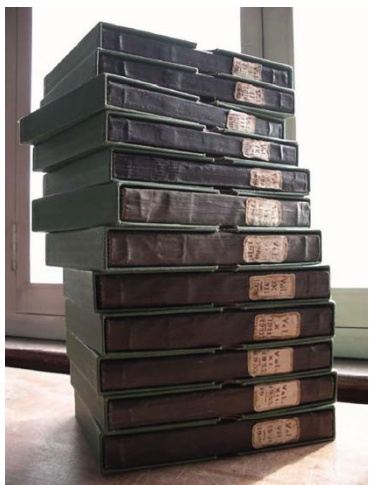
Els dotze volums dels diaris de Margaret Fontaine.

Es varen trencar els precintes de la capça i s'aixecà la tapa. En el seu interior hi havia dotze volums idèntics, com llibres de comptabilitat, amb la mateixa enquadrernació, cadascun d'ells de la mida i gruix d'un llistí telefònic i tots escrits amb la lletra clara i pulcra de Margaret Fontaine: es tractava dels diaris que havia escrit des que tenia setze anys i fins l'any anterior a la seva mort, 3.203 pàgines i més d'un milió de paraules 16 .