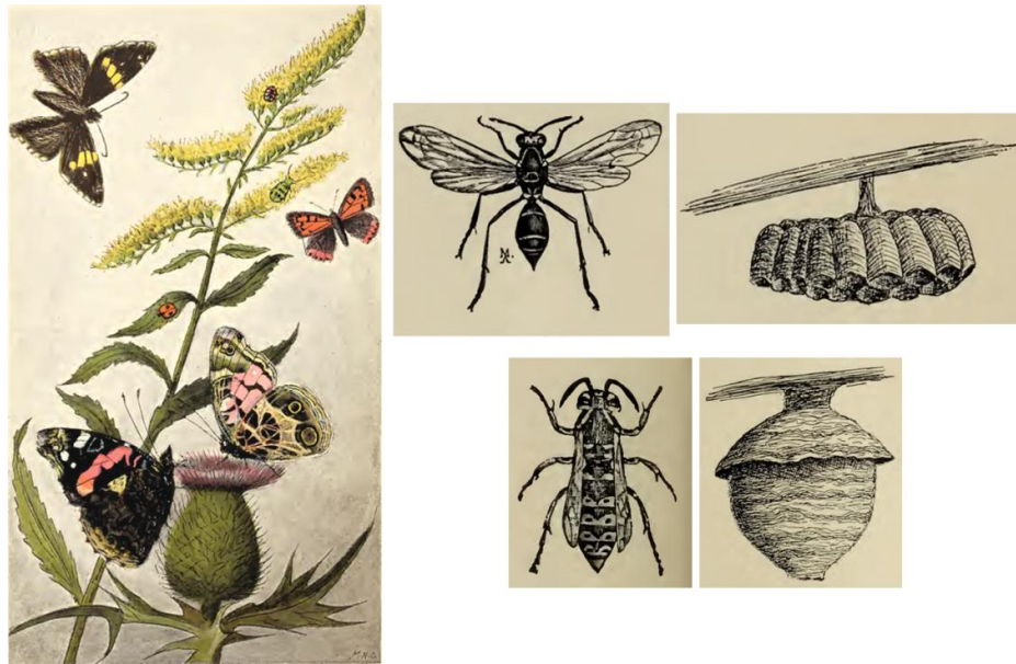
Ilustraciones aparecidas en su obra A manual for the study of insects : Izquierda, lámina I del frontispicio. Derecha, arriba y abajo, Polistes y Vespa y sus nidos.