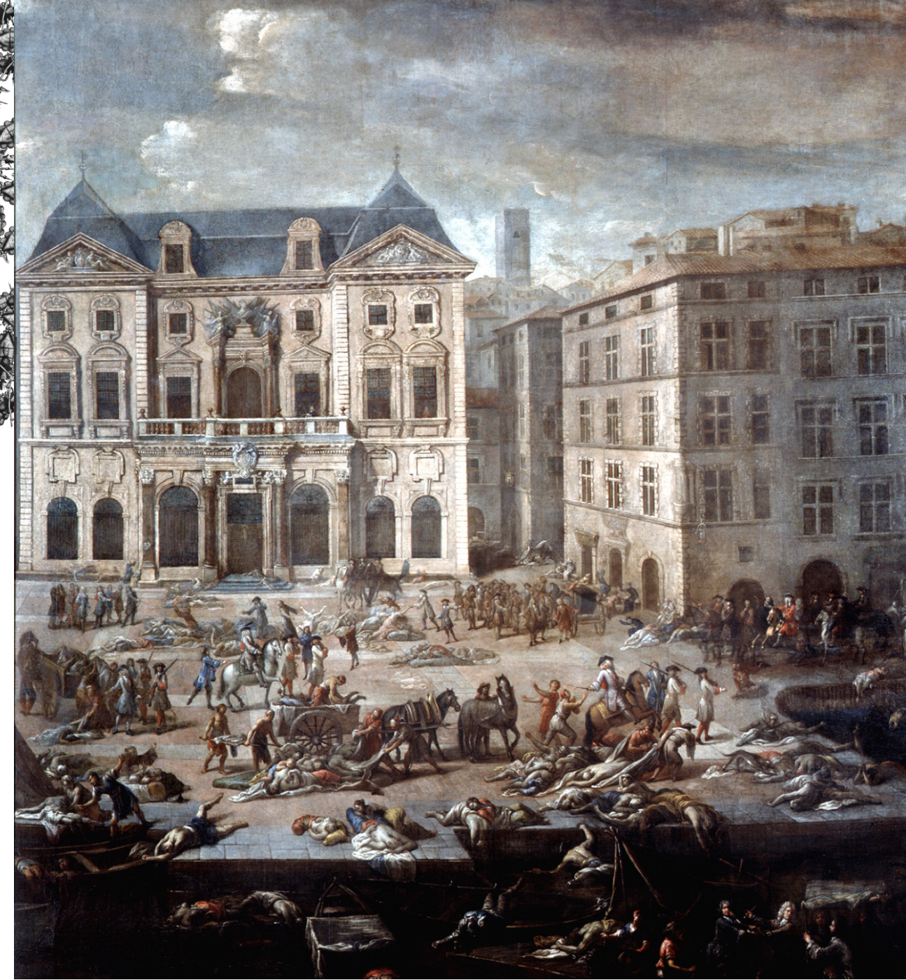
Páginas anteriores: el piojo y la pulga, y La peste en Roma, por Jules Delaunay. En esta página: La peste en Marsella, por Michel Serre, y un médico de la peste en Venecia